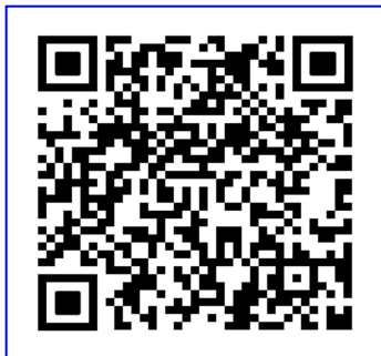
合肥师范学院网上缴费二维码

登录名：录取通知书上的学号，初始登录密码：Hfnu@身份证号码后6位(如末位为字母，请用大写)。首次登录后，请仔细核对个人信息：姓名、学号、录取专业班级。关注下方右边“合肥师范学院财务处官方微信公众号”，回复“缴费”，即可获取操作指南。