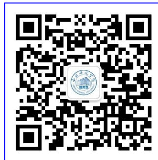
合肥师范学院财务处官方微信公众号

2. 学校为各位同学统一代办建行实名储蓄卡，学生到校报到后在所属院系领取。就读期间，所有奖助学金、教材结算等均通过此卡办理，请收到卡后及时激活，并妥善保管、持续使用。