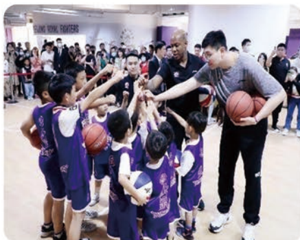
学生参与企业活动